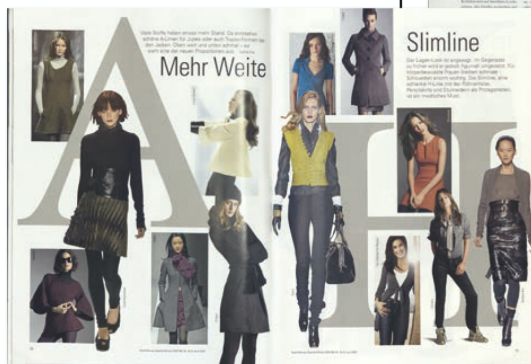
Trendseiten in der Textil-Revue, 8. Juni 2007

Die Magazine zum Globus AG feiern ihr 100-jähriges Jubiläum.