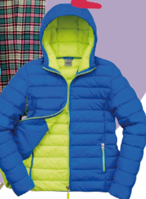
Urban Snowbird Steppjacke mit Kapuze von MANOR