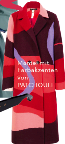
Mantel mit Farbakzenten von PATCHOULI