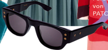
Sonnenbrille von MESSNER OPTIK