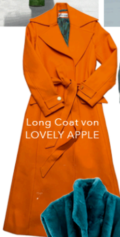
Long Coat von LOVELY APPLE