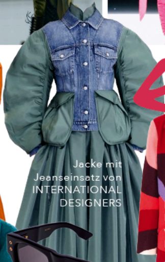
Jacke mit Jeansinsatz von INTERNATIONAL DESIGNERS