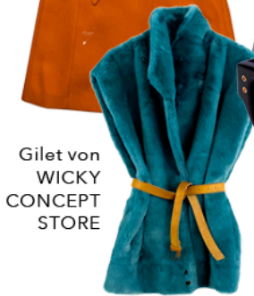
Gilet von WICKY CONCEPT STORE